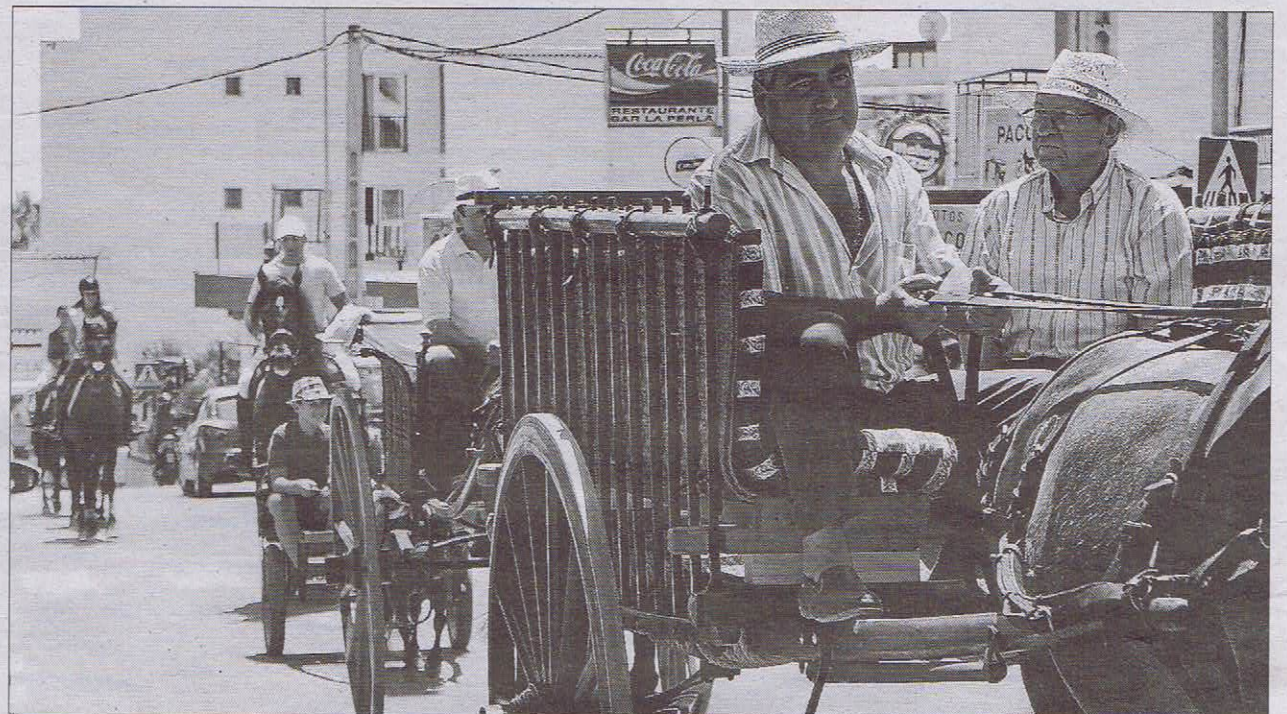
▲ A caballo y en carro bajo el sol. Como en toda fiesta patronal que se precie en Eivissa no faltó el desfile de carros de barana y de jinetes a caballo en honor a Sant Cristòfol. Sin embargo, en esta ocasión, únicamente marcharon por las calles de es Canar seis carros y tres jinetes. ■ Fotos: NATALIA NAVARRO