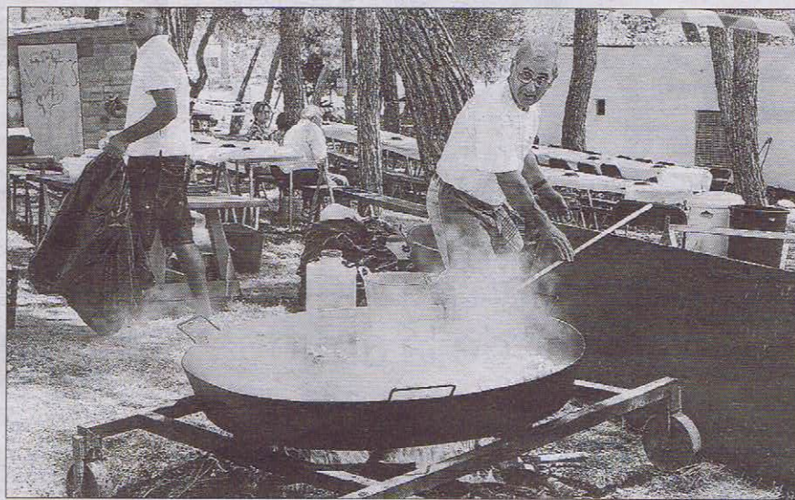
Tras un año de paréntesis, en este 2013 volvió el tradicional concurso de paellas.

En el desfile solo se pudieron apreciar unos 6 carros y 3 jinetes con sus caballos. No hubo muchos, pero la gente, tanto del pueblo como los turistas, esperaron a que pa-