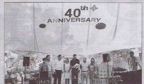
40 aniversario del Mercadillo de Punta Arabí. Uno de los momentos más emotivos del día grande de Es Canar fue el merecido homenaje que recibió por la tarde este tradicional mercadillo hippy con motivo de sus primeros cuarenta años de vida. ■